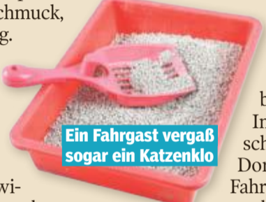
Ein Fahrgast vergaß sogar ein Katzenklo

Die längste Fahrt liegt bei über 1000 Kilometern und ging von Frankfurt/Main ins französische Mar-seille. Dauer: zehneinhalb Stunden. Kosten: rund 1500 Euro. Die kürzeste Fahrt fand in München statt. Nach 52 Sekunden war das Ziel erreicht. Die freundlichsten Fahrer sind laut Bewertungs-Ranking in Stuttgart unterwegs, die angenehmsten Fahrgäste in Augsburg. Der Viel-Fahrer: Ein Berliner ist der Buchungs-König. Er fuhr 1288-mal im Uber-Shuttle. Der umtriebige Chauffeur: Er kommt auf über 35.000 Uber-Transfers. In zehn Jahren macht das rund 9,5 Fahrten pro Tag - ohne Urlaub oder Wochenende. Das meiste Trinkgeld: Der Rekord liegt bei 100 Euro. Im Durchschnitt sind die Dortmunder Fahrgäste am spendabelsten. Frühaufsteher: morgens am ehesten rufen die Leverkusener ihre Fahrgelegenheit. Nachtschwärmer: In Bergisch Gladbach gibt es die häufigsten Fahrten nach 22 Uhr.