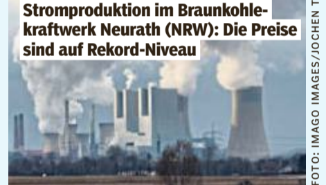
Stromproduktion im Braunkohlekraftwerk Neurath (NRW): Die Preise sind auf Rekord-Niveau

Um den Familiennachzug auszusetzen, brauche es eine „gesetzliche Änderung“, heißt es auf BILD-Anfrage unisono aus dem Bundesinnen- und -außenministerium. Man beobachte „die Lage in Syrien genau“.