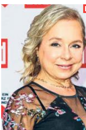
Heute schreibt Tatort-Star Christine Urspruch (54)

Jeden Tag schreibt ein Promi aus Show, Politik oder Sport die Weihnachtsgeschichte fort – bis zum Heiligabend. Wie es ausgeht, das weiß bisher niemand. Heute schreibt Tatort-Star Christine Urspruch (54) die Geschichte fort. Wenn Sie den QR-Code scannen, können Sie die Weihnachtsgeschichte von Beginn an nachlesen.