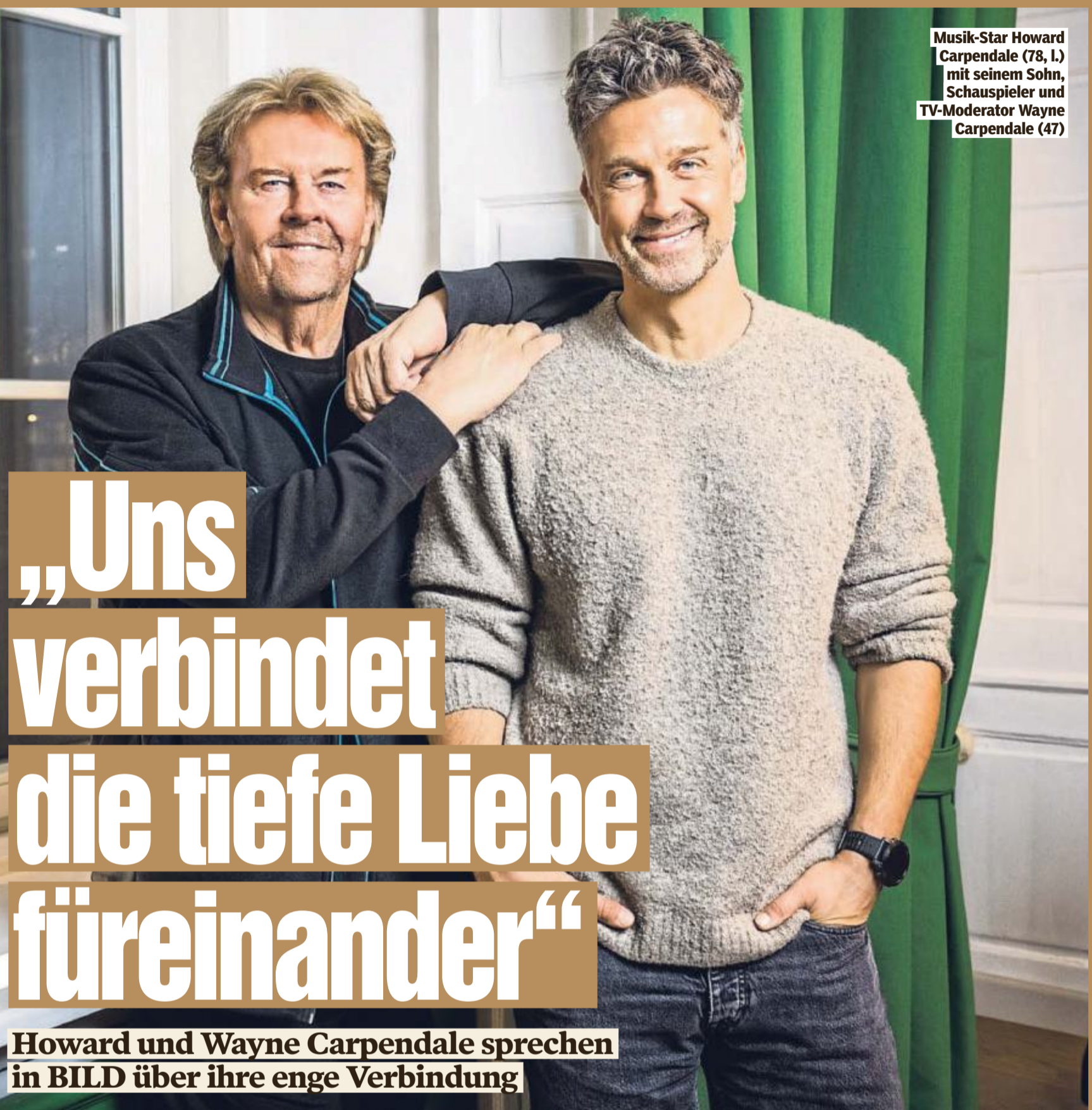
Musik-Star Howard Carpendale (78, l.) mit seinem Sohn, Schauspieler und TV-Moderator Wayne Carpendale (47)

Sagt der Ehemann zu seiner Frau: „Schatz, wo sind denn meine Golfsocken?“ „Welche Golfsocken?“ „Na die mit den 18 Löchern.“