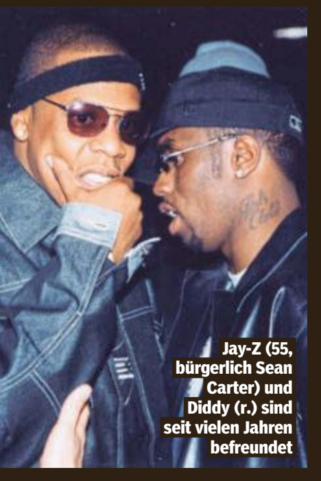
Jay-Z (55, bürgerlich Sean Carter) und Diddy (r.) sind seit vielen Jahren befreundet