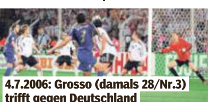
4.7.2006: Grosso (damals 28/Nr.3) trifft gegen Deutschland

0:2 n.V. Die Gesamtbilanz gegen die Azzurri: 38 Spiele, 11 Siege, 12 Unentschieden, 15 Niederlagen.