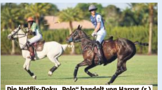
Die Netflix-Doku „Polo“ handelt von Harrys (r.) Lieblingssport und enttäuscht die Zuschauer