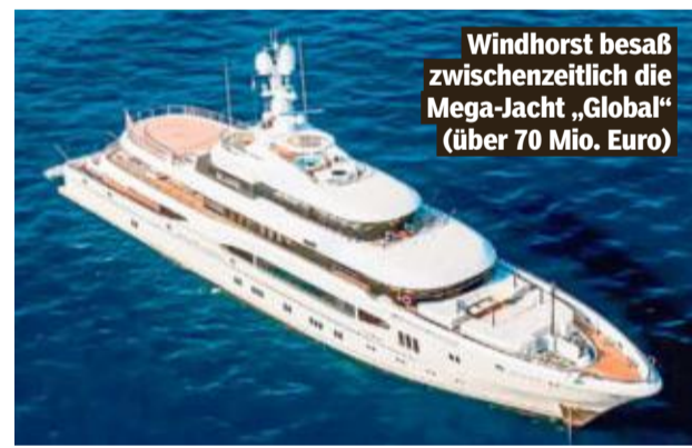
Windhorst besaß zwischenzeitlich die Mega-Yacht „Global“ (über 70 Mio. Euro)