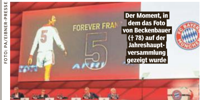
Der Moment, in dem das Foto von Beckenbauer (78) auf der Jahreshauptversammlung gezeigt wurde

den Ball zu erlaufen. Ich habe gemerkt, das wird eine enge Geschichte, ich komme nicht mehr hin.“ Der Weltmeister war vergangene Woche im Pokal wegen einer Notbremse gegen Leverkusens Jeremie Frimpong vom Platz geflogen. Neuer zog sich dabei einen Rippenbruch zu.