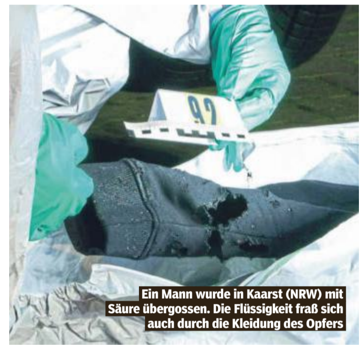
Ein Mann wurde in Kaarst (NRW) mit Säure übergossen. Die Flüssigkeit fraß sich auch durch die Kleidung des Opfers

Magdeburg – Der Kreistag im Landkreis Harz (Sachsen-Anhalt) beschloss den Kauf des Brockenplateaus. Die Bergkuppe soll von einem Bankkonsortium zurückgekauft und touristisch weiterentwickelt werden. Die Investitionskosten werden auf rund 3 Mio. Euro geschätzt. Das Brockenplateau (1141 Meter) ist die Hauptattraktion des Harzes. Funkturm und Brockenhotel wurden 2008 an ein Konsortium aus NordLB und Harzsparkasse verkauft.