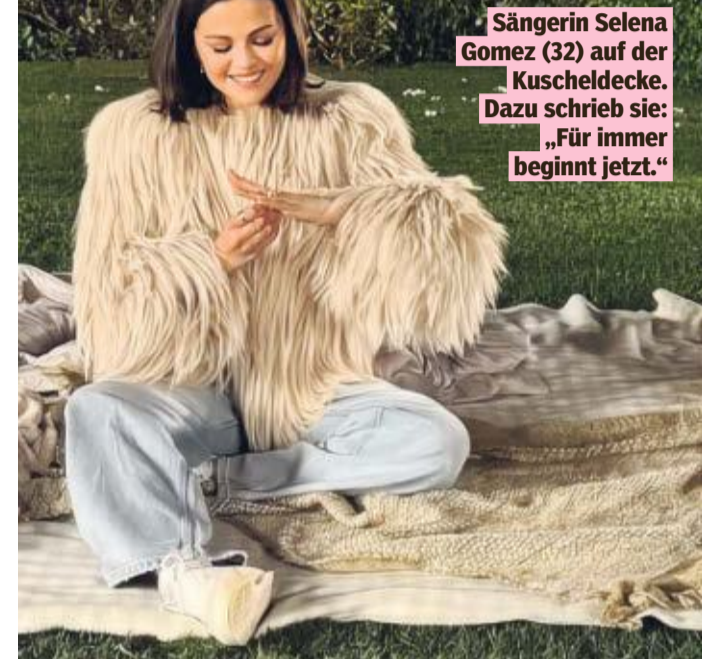
Sängerin Selena Gomez (32) auf der Kuscheldecke. Dazu schrieb sie: „Für immer beginnt jetzt.“