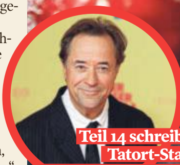
Teil 14 schreibt Tatort-Star Jan Josef Liefers (60)