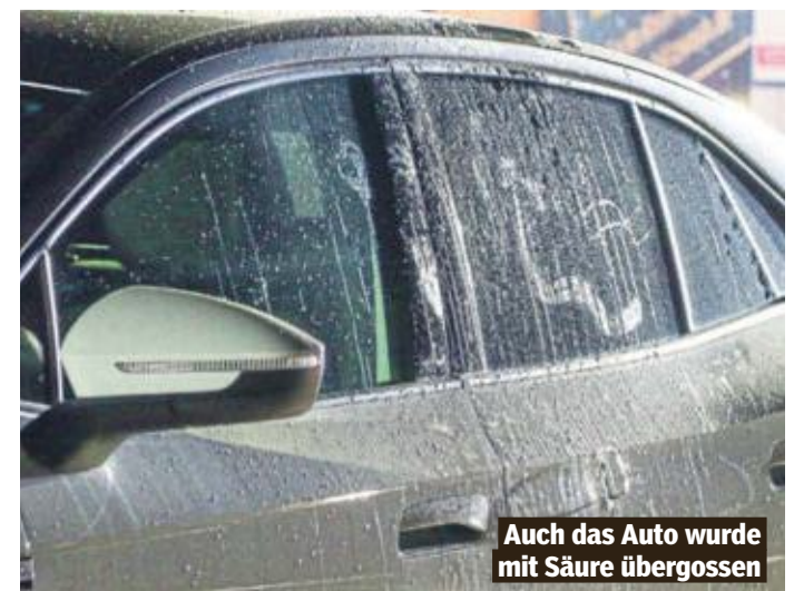
Auch das Auto wurde mit Säure übergossen