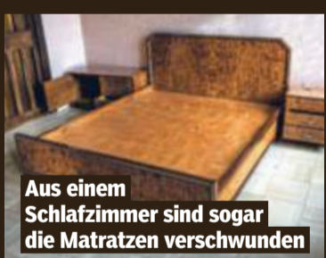
Aus einem Schlafzimmer sind sogar die Matratzen verschwunden