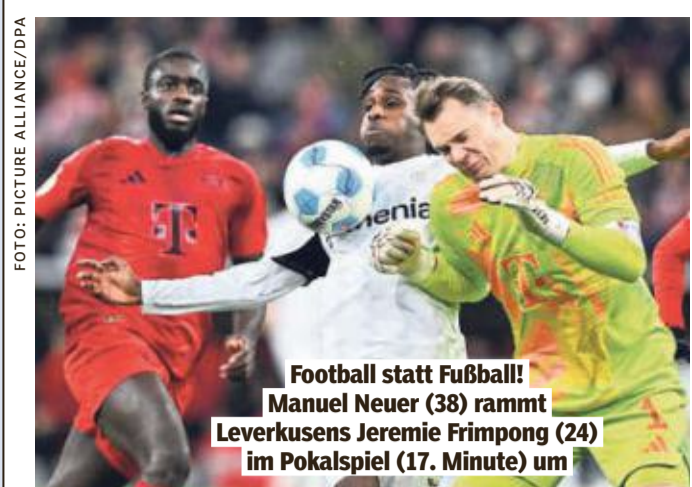
Football statt Fußball! Manuel Neuer (38) rammt Leverkusens Jeremie Frimpong (24) im Pokalspiel (17. Minute) um