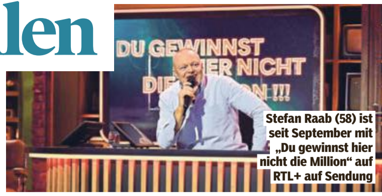
Stefan Raab (58) ist seit September mit „Du gewinnst hier nicht die Million“ auf RTL+ auf