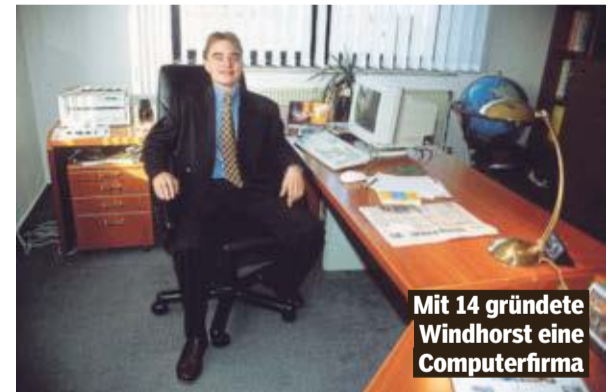
Mit 14 gründete Windhorst eine Computerfirma