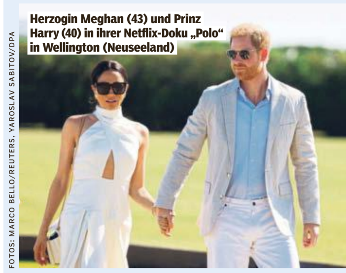
Herzogin Meghan (43) und Prinz Harry (40) in ihrer Netflix-Doku „Polo“ in Wellington (Neuseeland)