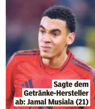
Sagte dem Getränke-Hersteller ab: Jamal Musiala (21)