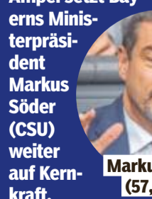
Markus Söder (CSU) will in neue AKW investieren

Prag - Ein Jahr nach dem Atomausstieg der Ampel setzt Bayerns Ministerpräsident