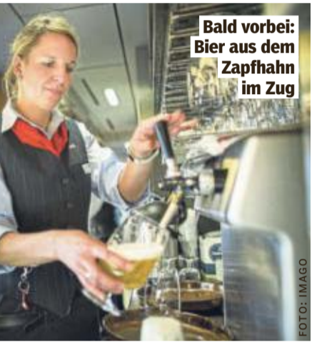
Bald vorbei: Bier aus dem Zapfhahn im Zug

Grund: die veränderte Kundennachfrage. Während Fassbier 2010 noch einen Anteil von 50 % am Verkauf ausmachte, sind es mittlerweile nur noch 15 %. Ab Februar werden sieben verschiedene Flaschenbiere angeboten.