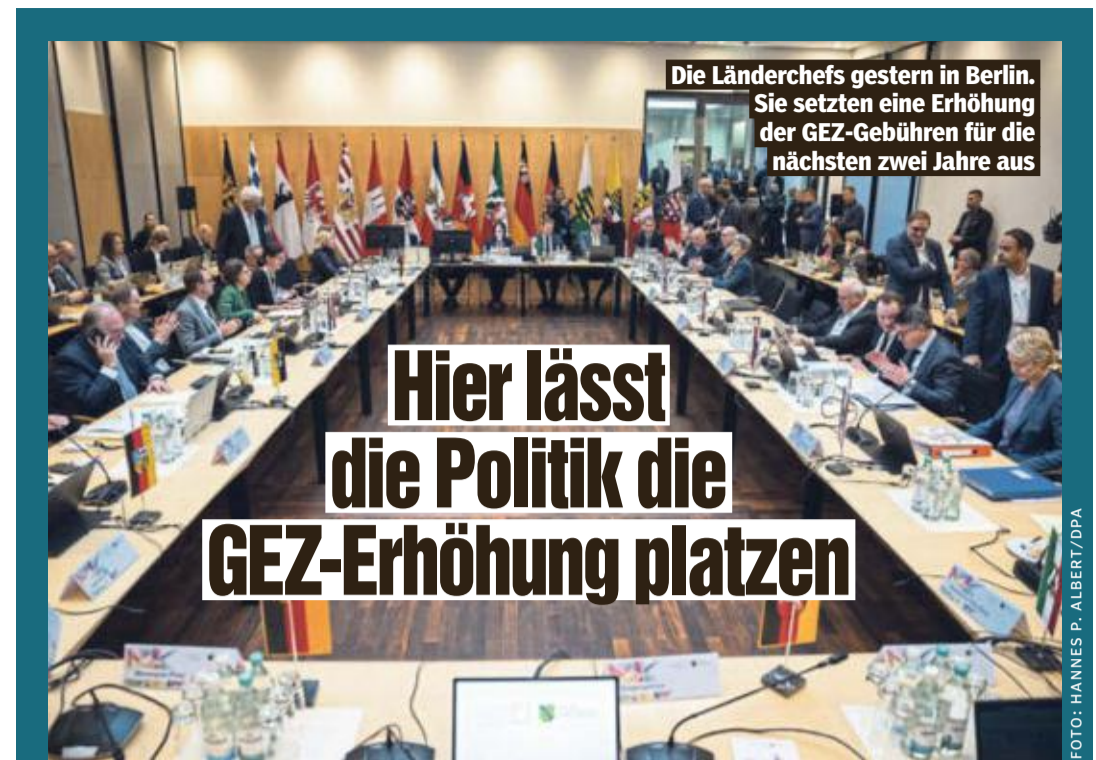
Die Länderchefs gestern in Berlin. Sie setzen eine Erhöhung der GEZ-Gebühren für die nächsten zwei Jahre aus