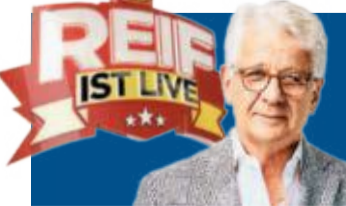
Auch als Podcast

Und weiter: „Die Borussia ist ein merkwürdiges Gebilde schon über die gan-