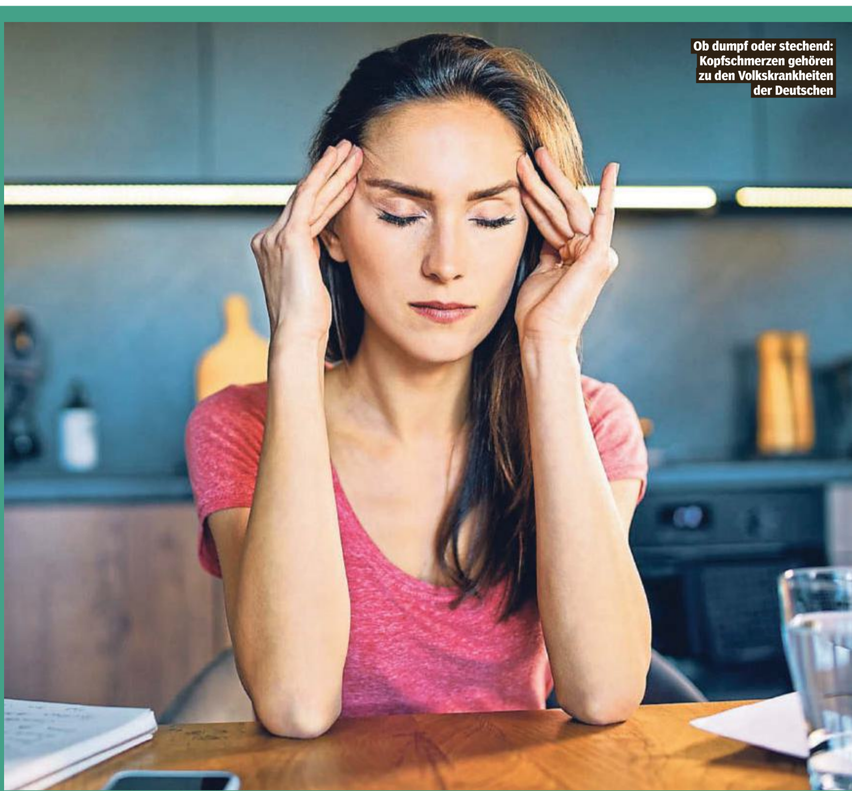
Ob dumpf oder stechend: Kopfschmerzen gehören zu den Volkskrankheiten der Deutschen

Berlin – Das Bundesamt für Bevölkerungsschutz und Katastrophenhilfe (BBK) fordert die Deutschen auf, sich auf den Ausfall kritischer Infrastruktur vorzubereiten. Jeder Haushalt sollte sich drei Tage lang selbst versorgen können, auch bei Stromausfällen. Lichtquellen, die nicht vom Strom abhängig sind, Bargeld sowie Vorräte an Wasser und Lebensmitteln seien wichtig. Das sei notwendig, da die Anzahl hybrider Attacken steige.