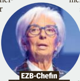
EZB-Chefin Christine Lagarde