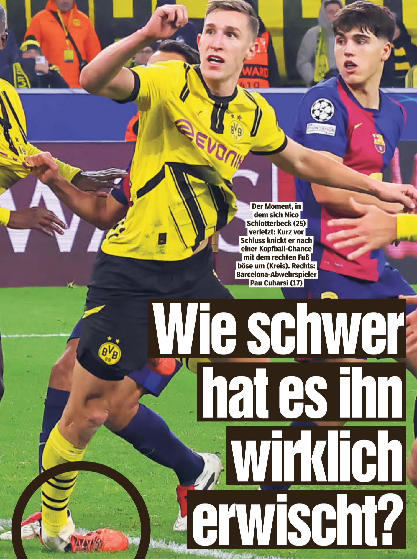
Der Moment, in dem sich Nico Schlotterbeck (25) verletzt: Kurz vor Schluss knickt er nach einer Kopfball-Chance mit dem rechten Fuß böse um (Kreis). Rechts: Barcelona-Abwehrspieler Pau Cubarsi (17)

Wie schwer hat es ihn wirklich erwischt?