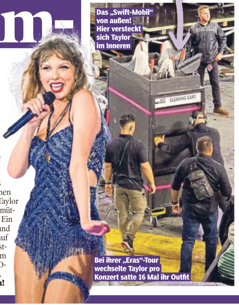
Das „Swift-Mobil“ von außen! Hier versteckt sich Taylor im Inneren

Ins Innere gab es hingegen nie einen Blick – bis jetzt. Taylor hat es sich richtig gemütlich eingerichtet. Ein gepolsterter Sitz und ein grüner Griff auf dem Dach zum Festhalten. Außerdem schmücken LED-Lichter das Innere. Echt angenehm!