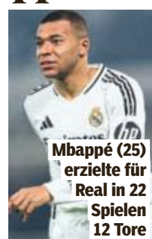
Mbappé (25) erzielte für Real in 22 Spielen 12 Tore

von sexueller Belästigung in einem Hotel in der Stockholmer Innenstadt im Oktober. Damals war von einem „begründeten Verdacht“ die Rede.