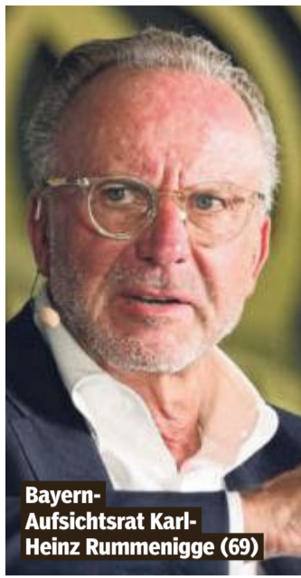
Bayern-Aufsichtsrat Karl-Heinz Rummenigge (69)

Damals rissen Diebe in Kahns Villa einen Tresor aus der Wand. Vermutlich mehrere ortskundige Einbrecher hatten die Sicherheitsanlage überwunden. Statt den Safe aufzubrechen, bauten die Diebe ihn aus und nahmen ihn mit.