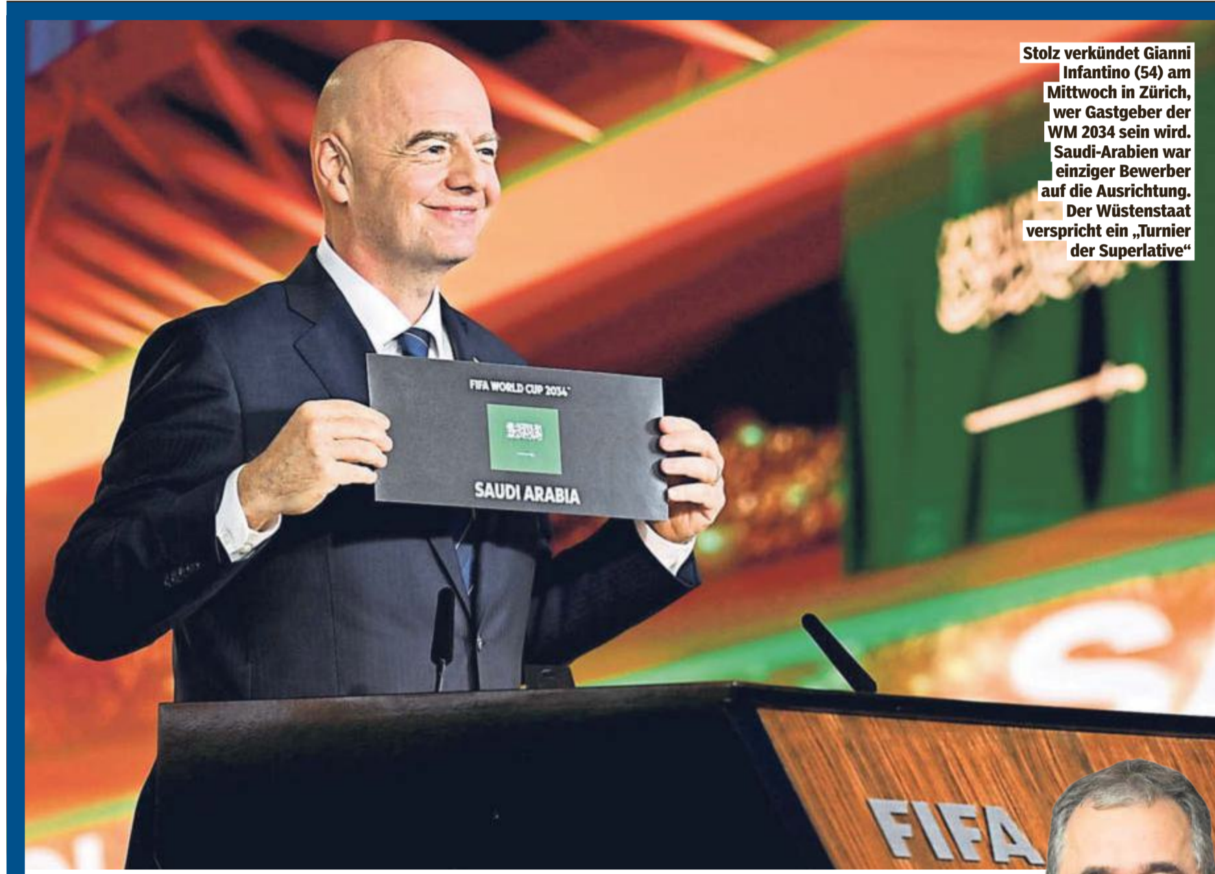
Stolz verkündet Gianni Infantino (54) am Mittwoch in Zürich, wer Gastgeber der WM 2034 sein wird. Saudi-Arabien war einziger Bewerber auf die Ausrichtung. Der Wüstenstaat verspricht ein „Turnier der Superlative“

Am 11. Juni mit dem Eröffnungsspiel in Mexiko-Stadt. Finale: 19. Juli in East Rutherford (USA).