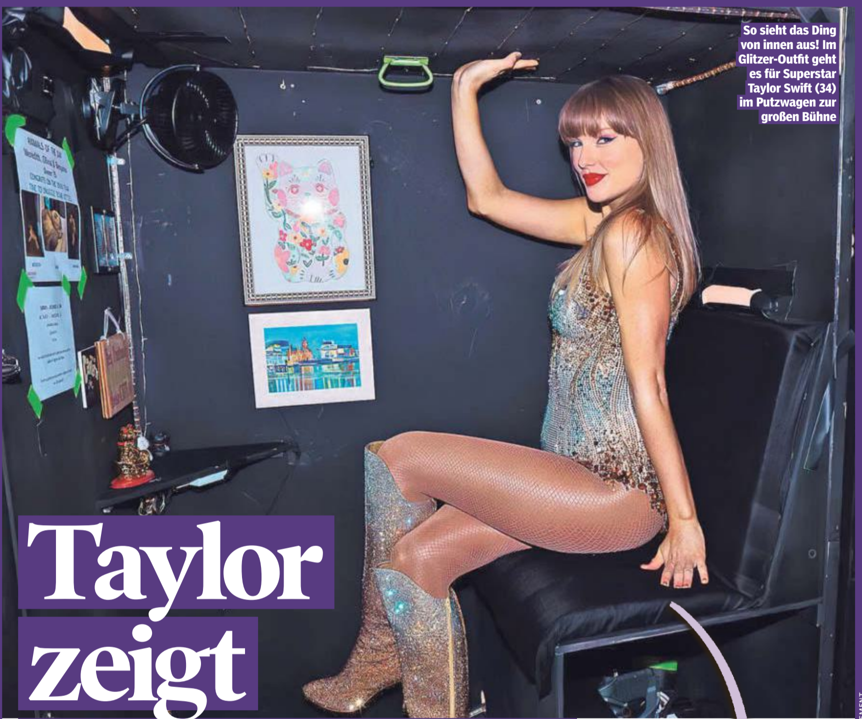
So sieht das Ding von innen aus! Im Glitzer-Outfit geht es für Superstar Taylor Swift (34) im Putzwagen zur großen Bühne