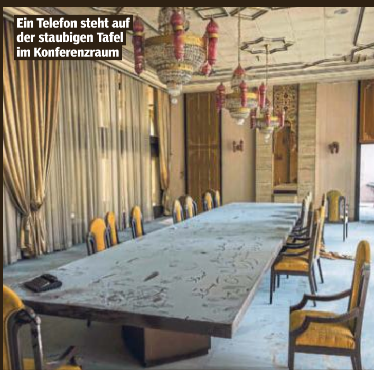
Ein Telefon steht auf der staubigen Tafel im Konferenzraum

Draußen, unter einer Palme, finden wir doch noch ein Bild: ein Porträt von Wladimir Putin, auf Holz gespannt. Durchgebrochen, kaputt getreten und liegen gelassen, niemand wollte es haben.