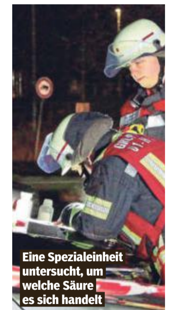
Eine Spezialeinheit untersucht, um welche Säure es sich handelt

Der Täter flüchtete zunächst zu Fuß, stieg dann in ein Auto und raste davon. Motiv unklar, so die Polizei: „Wir gehen momentan von einer gezielten Tat aus. Eine Gefahr für die Bevölkerung besteht aktuell nicht.“