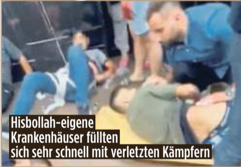
Hisbollah-eigene Krankenhäuser füllten sich sehr schnell mit verletzten Kämpfern

Doch ob die Pieper- und Walkie-Talkie-Attacken der Auftakt zu einer größeren Konfrontation im Libanon sind, bleibt abzuwarten. Das gut informierte Portal „Axios“ berichtet, die Simultan-Explosionen hätten ursprünglich