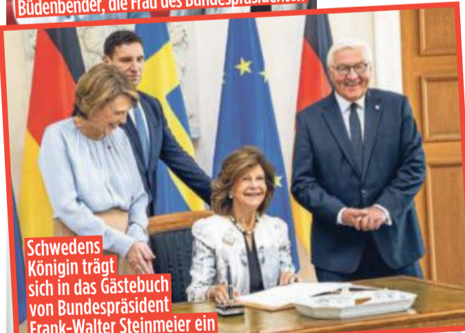
Schwedens Königin trägt sich in das Gästebuch von Bundespräsident Frank-Walter Steinmeier ein