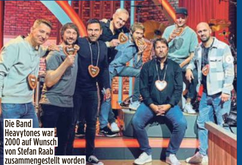
Die Band Heavytones war 2000 auf Wunsch von Stefan Raab zusammengestellt worden

Konsequenz: Die Verantwortlichen zogen die Reißleine. Die Heavytones konnten sofort gehen. J. Puthenpurackal, M. Japes