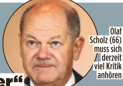
Olaf Scholz (66) muss sich derzeit viel Kritik anhören

SPD-Politiker wiesen auch daraufhin, dass eine erneute Kanzlerkandidatur von Scholz nicht selbstverständlich sei. „Die Partei legt fest, wer Kandidat ist“, so ein führende Fachpolitikerin zu BILD.