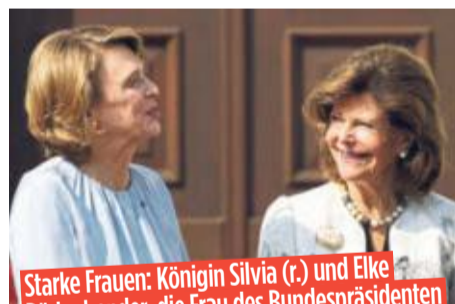
Starke Frauen: Königin Silvia (r.) und Elke Bundenbender, die Frau des Bundespräsidenten

Berlin – „Unserre“ Silvia (80) ist wieder in Deutschland. Die in Heidelberg gebore-