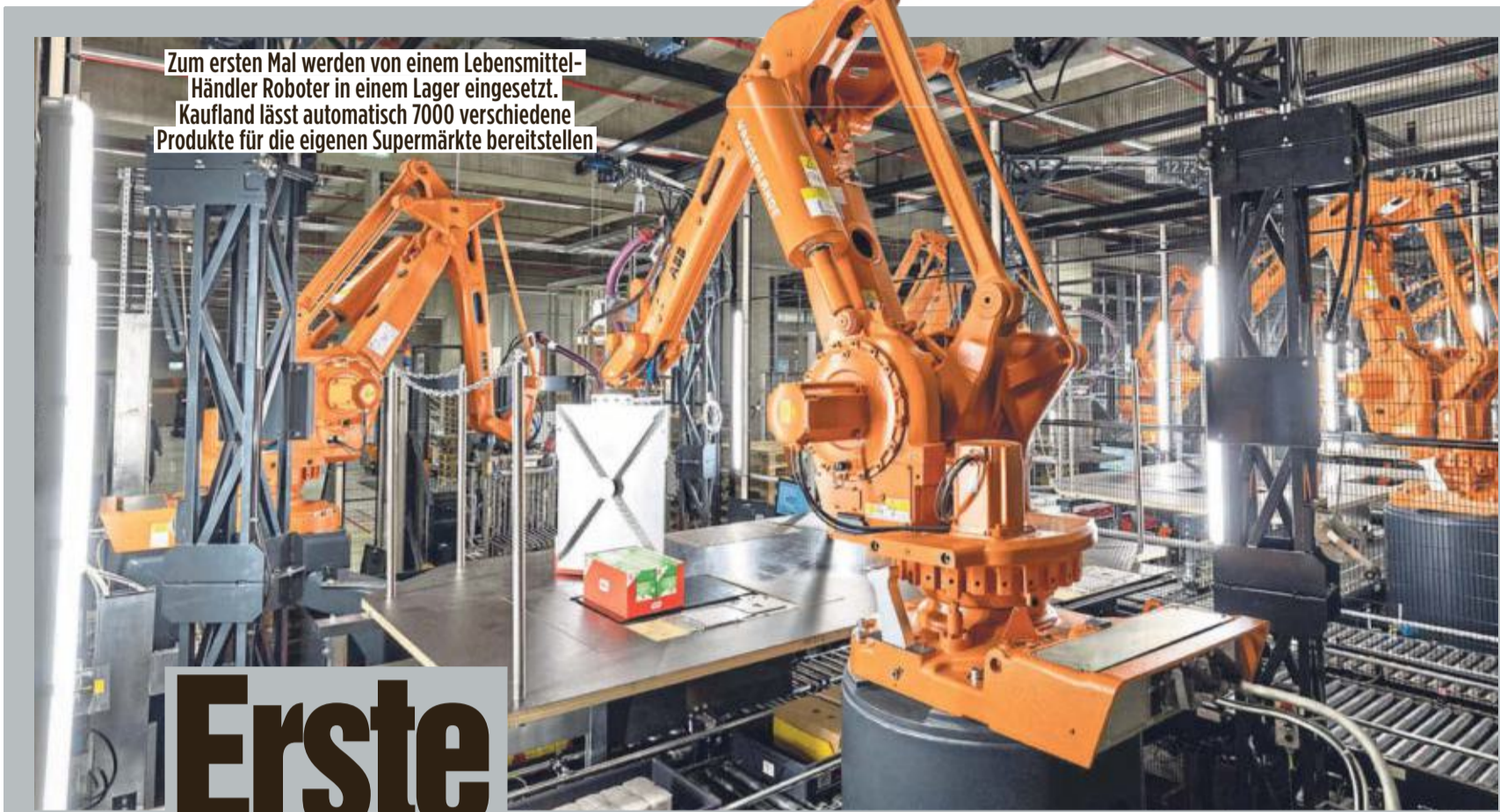
Zum ersten Mal werden von einem Lebensmittel-Händler Roboter in einem Lager eingesetzt. Kaufland lässt automatisch 7000 verschiedene Produkte für die eigenen Supermärkte bereitstellen