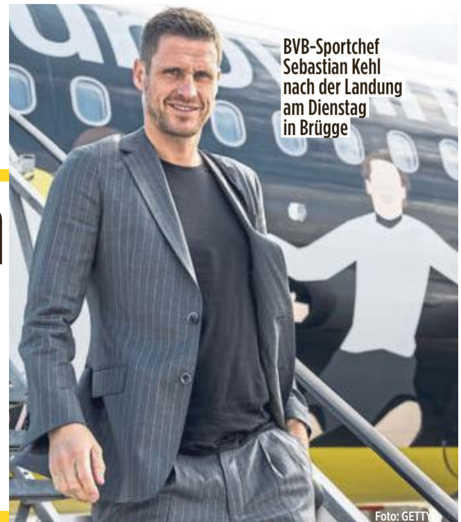
BVB-Sportchef Sebastian Kehl nach der Landung am Dienstag in Brügge