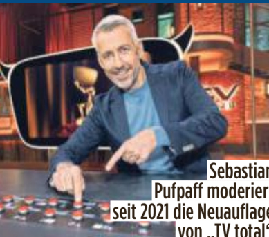
Sebastian Pufpaff moderiert seit 2021 die Neuaufgabe von „TV total“

Wie BILD erfuhr, war eigentlich geplant,