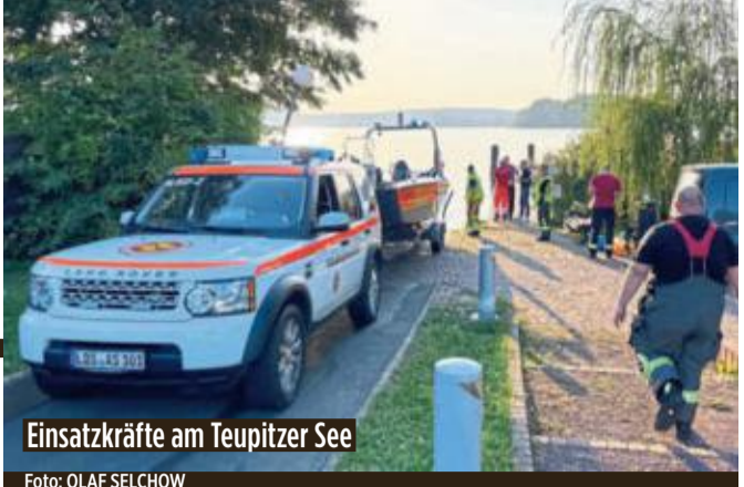
Einsatzkräfte am Teupitzer See

Die drei Leichen wurden ins Gerichtsmedizinische Institut gebracht. Nach BILD-Informationen fanden die Ermittler später einen Abschiedsbrief der Mutter. Wie genau die Frau und die Kinder zu Tode kamen, soll nun eine Obduktion klären. K. Metag, D. Böttger