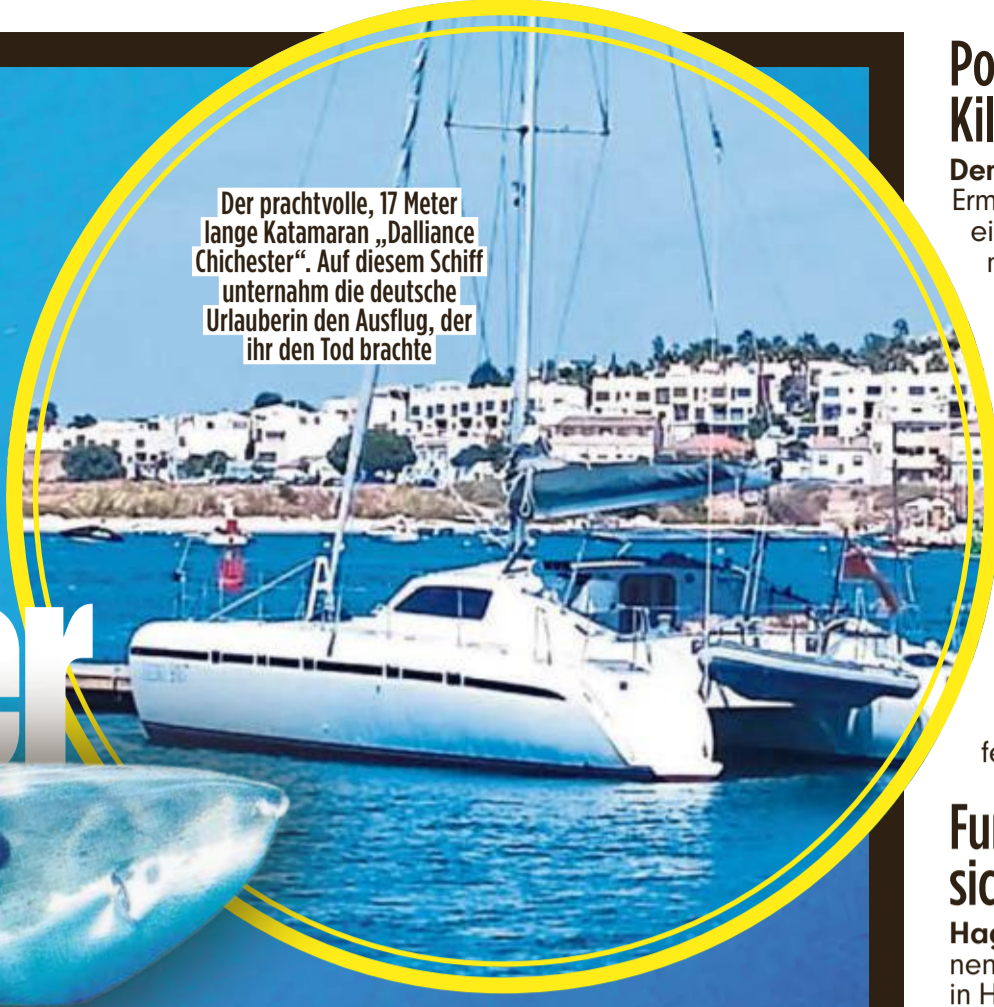
Der prachtvolle, 17 Meter lange Katamaran „Dalliance Chichester“. Auf diesem Schiff unternahm die deutsche Urlauberin den Ausflug, der ihr den Tod brachte