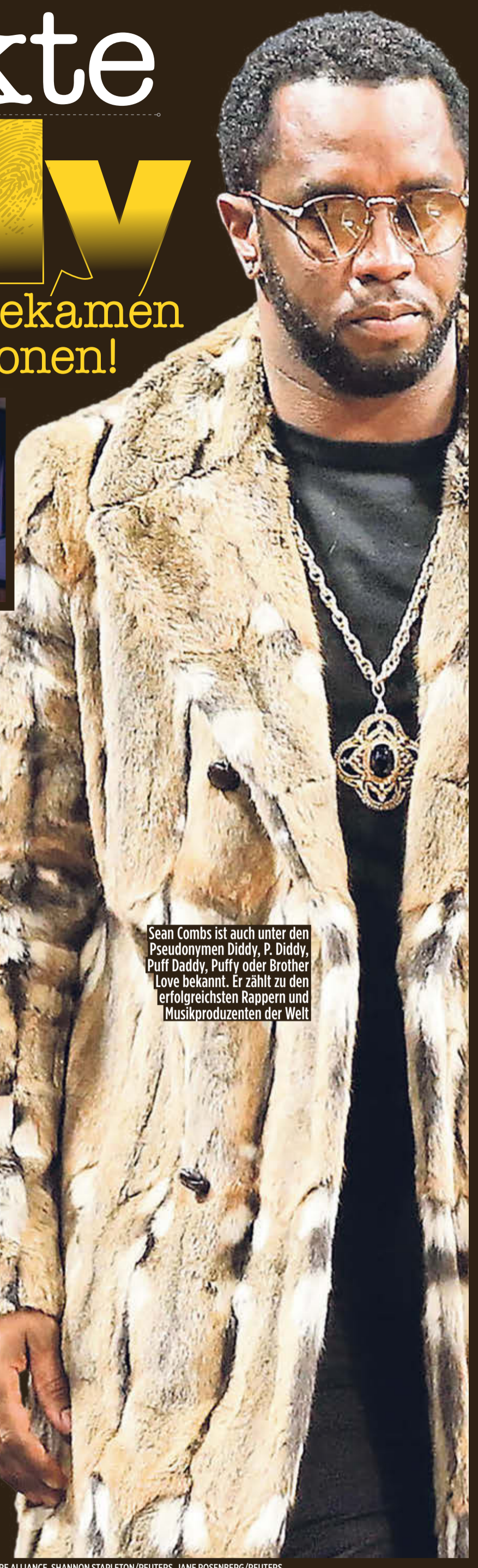
Sean Combs ist auch unter den Pseudonymen Diddy, P. Diddy, Puff Daddy, Puffy oder Brother Love bekannt. Er zählt zu den erfolgreichsten Rappern und Musikproduzenten der Welt