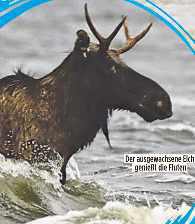
Der ausgewachsene Elch genießt die Fluten