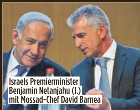
Israels Premierminister Benjamin Netanjahu (l.) mit Mossad-Chef David Barnea

dem Attentat auf die israelische Olympia-Mannschaft in München (zwölf Tote) über 20 Jahre gegen Täter und Hintermänner. Sabotage des iranischen Atom-Programms, Ermordung mehrerer Nuklear-