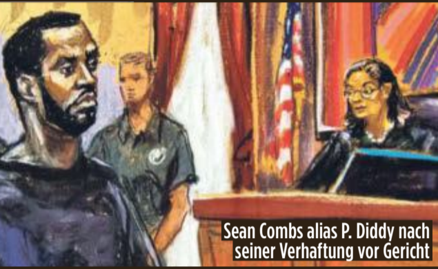
Sean Combs alias P. Diddy nach seiner Verhaftung vor Gericht

P. Diddy habe seit mindestens 2008 immer wieder körperliche Gewalt gegen Frauen ausgeübt, indem er sie schlug oder würgte - dafür gebe es laut Anklage zahlreiche Zeugen.