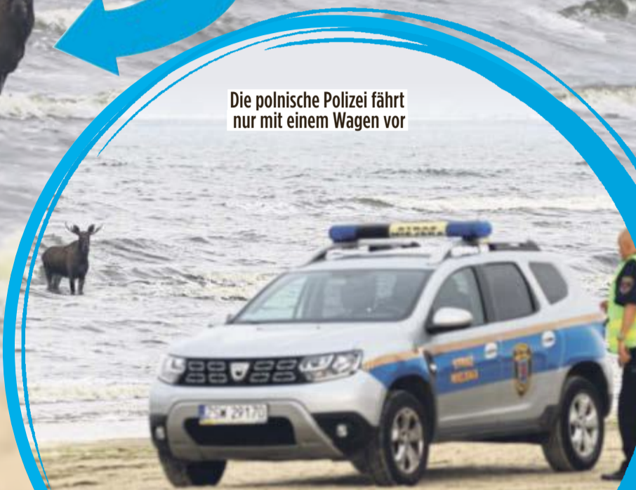
Die polnische Polizei fährt nur mit einem Wagen vor

Die deutsche Polizei gab zu Protokoll: „Gegen 14.25 Uhr wurde der Polizeieinsatz mit dem Grenzübertritt auf polnisches Staatsgebiet beendet.“