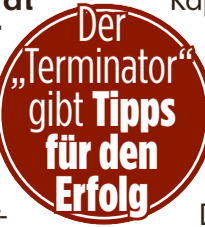
Der „Terminator“ gibt Tipps für den Erfolg