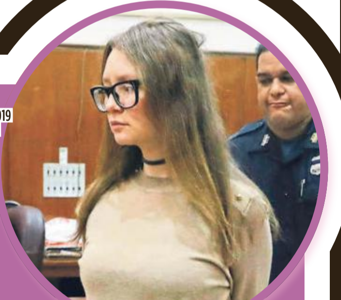
Anna Sorokin 2019 in Handschellen vor Gericht

ALBERT VON MONACO (66) IN DER ZEITUNG „CORRIERE DELLA SERA“ ÜBER DIE BEDEUTUNG DER MONARCHIEN