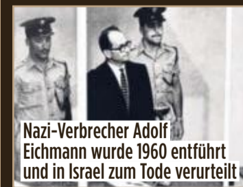
Nazi-Verbrecher Adolf Eichmann wurde 1960 entführt und in Israel zum Tode verurteilt