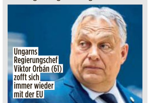
Ungarns Regierungschef Viktor Orbán (61) zofft sich immer wieder mit der EU

Die Strafe war im Juni vom Europäischen Gerichtshof (EuGH) wegen Verstößen der Regierung in