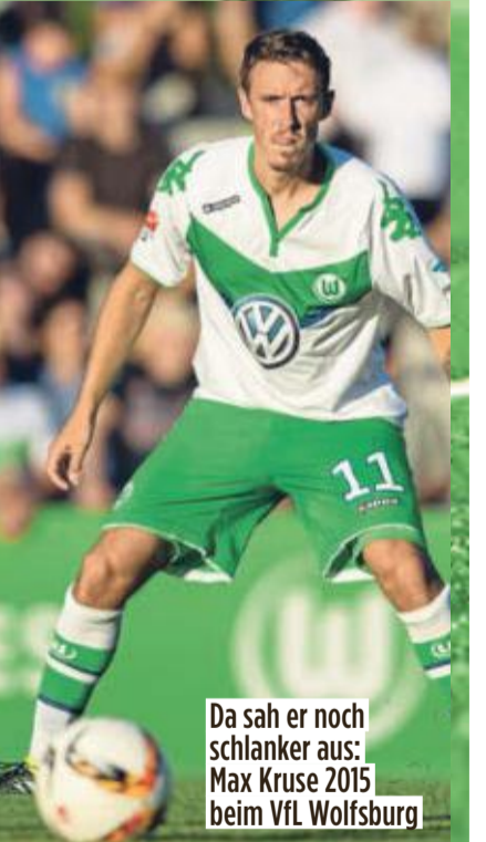
Da sah er noch schlanker aus: Max Kruse 2015 beim VfL Wolfsburg

ich nicht mehr.“ In Sachen Ernährung gab es bei Kruse bereits ein Umdenken: „Ich werde meine Ernährung nicht mehr so machen, wie die letzten sechs Monate, als ich mir alles links und rechts reingepfeffert habe. Das war sicherlich auch ein Punkt, der dazu beigetragen hat, dass ich 15 Kilo zugenommen habe. Wir haben jetzt die letzten 15 Jahre relativ gesund gelebt. Ich habe einfach keine Motivation zu sagen, jetzt mache ich das weiter.“