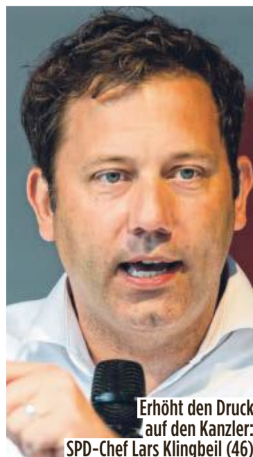
Erhöht den Druck auf den Kanzler: SPD-Chef Lars Klingbeil (46)