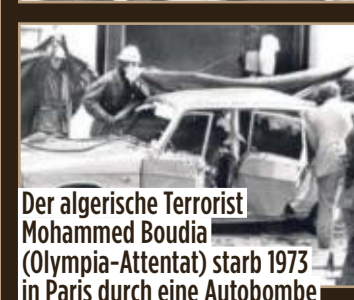
Der algerische Terrorist Mohammed Boudia (Olympia-Attentat) starb 1973 in Paris durch eine Autobombe

Israels Geheimdienst Mossad (gegründet 1949, ca. 7000 Mitarbeiter) gilt als legendär: kreativ, bestens organisiert und knallhart.