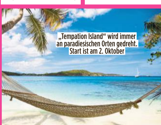
„Temptation Island“ wird immer an paradisischen Orten gedreht. Start ist am 2. Oktober

Ob die werdenden Eltern das überstehen, wird sich bald zeigen. Zumindest planen sie laut BILD-Infos zurzeit ihre Traumhochzeit.