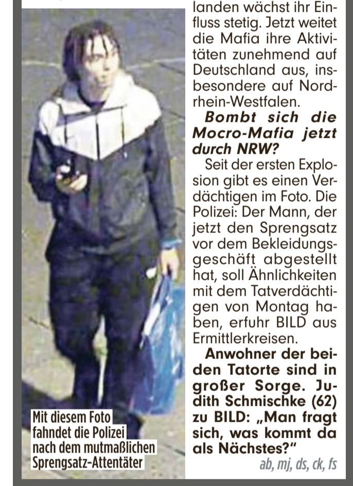
Mit diesem Foto fahndet die Polizei nach dem mutmaßlichen Sprengsatz-Attentäter

Köln – Schon wieder eine Explosion mitten in Köln! In der Nacht knallte es an einem Bekleidungs- geschäft auf der berühmten Ehrenstraße, nur wenige 100 Meter weit entfernt vom Ort der Explosion am Montagmorgen am Vanity-Club. Das Bekleidungs- geschäft „LFDY“ wurde weitgehend verwüstet.