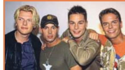
Füllten als Boyband Caught in the Act die größten Hallen: Bastiaan Ragas, Benjamin Boyce, Eloy de Jong und Lee Baxter (v.l.)