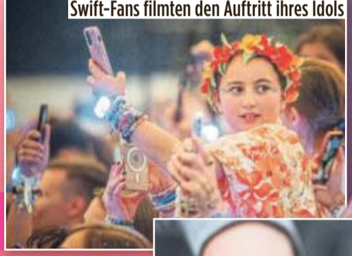
Swift-Fans filmten den Auftritt ihres Idols

Von TANJA MAY, NICO NÖLKEN, EILEEN PRIMUS und PATRIC FOUAD Gelsenkirchen – So viel Hysterie war nie!