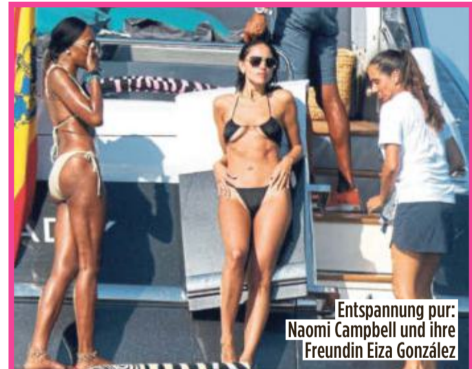
Entspannung pur: Naomi Campbell und ihre Freundin Eiza González

74 Km/h Spitzengeschwindigkeit) Kosten: 6250 Euro pro Badetag. No importa (dt. spielt keine Rolle)! Baden, brutzeln und zwischendurch unter der jacht-eigenen Brause erfrischen – so geht Urlaub der Power-Frauen!