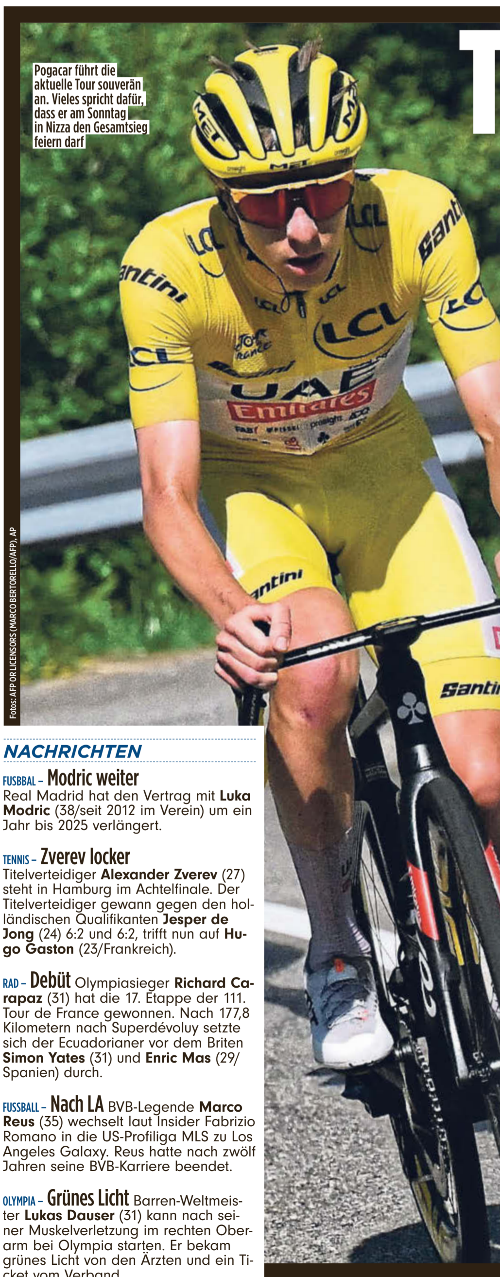
Pogacar führt die aktuelle Tour souverän an. Vieles spricht dafür, dass er am Sonntag in Nizza den Gesamtsieg feiern darf