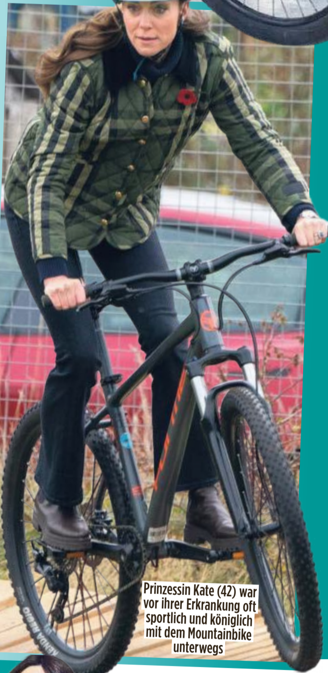
Prinzessin Kate (42) war vor ihrer Erkrankung oft sportlich und königlich mit dem Mountainbike unterwegs