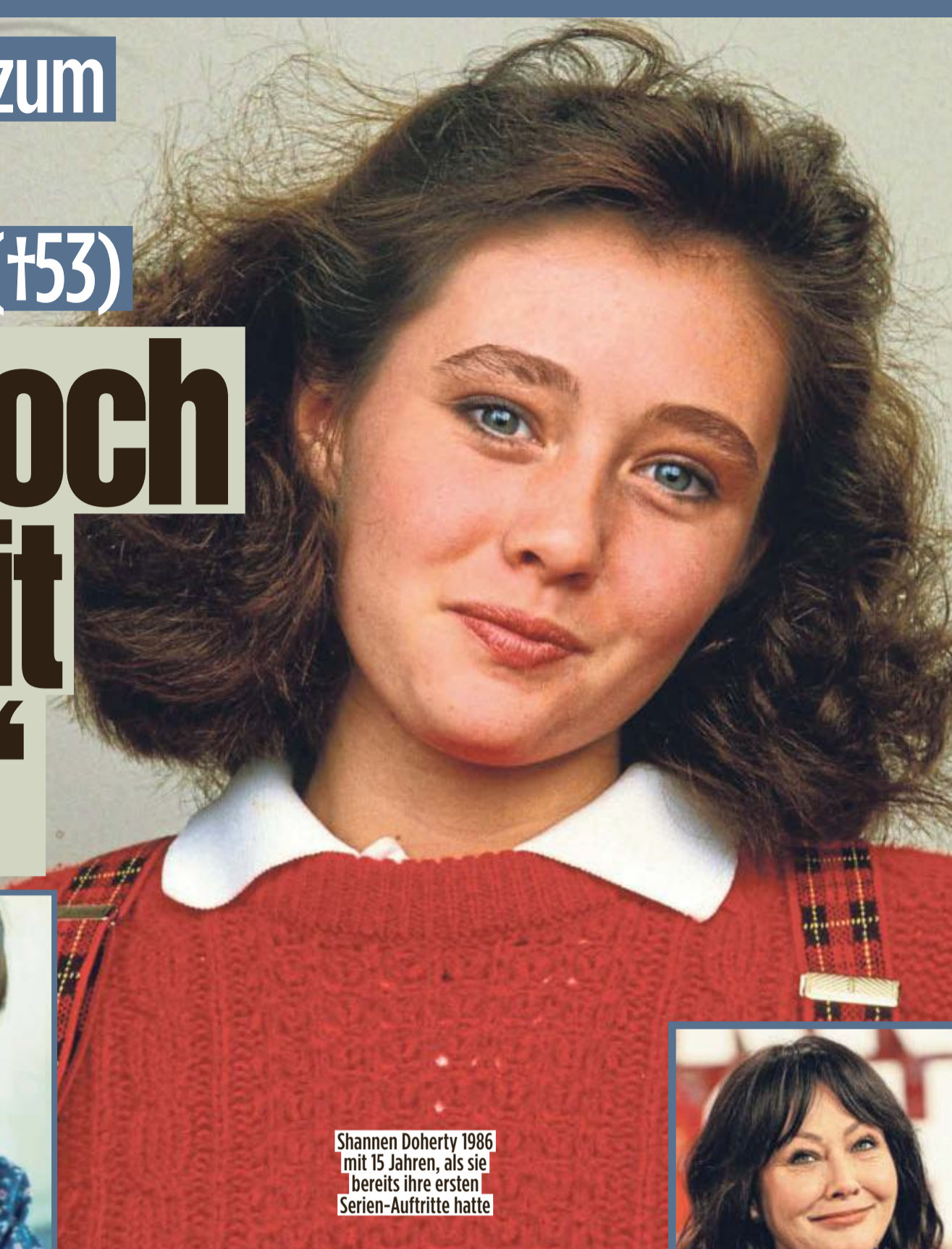
Shannen Doherty 1986 mit 15 Jahren, als sie bereits ihre ersten Serien-Auftritte hatte