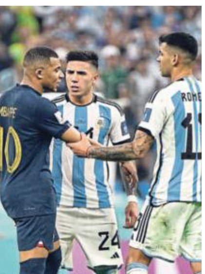
Kylian Mbappé (l.) im WM-Finale 2022 in Diskussionen mit Enzo Fernández und Christian Romero (r.). Argentinien gewann mit 4:2 i.E., nach Verlängerung stand es 3:3. Zuvor kamen die rassistischen Fan-Gesänge Richtung Mbappé und Co. erstmals auf