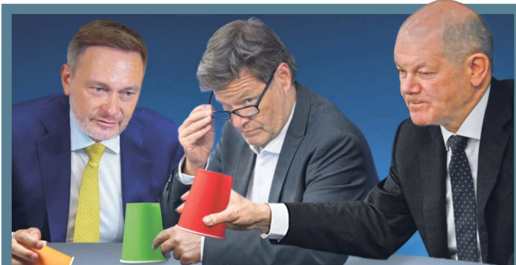
Finanzminister Christian Lindner (45, FDP), Wirtschaftsminister Robert Habeck (54, Grüne) und Kanzler Olaf Scholz (66, SPD)