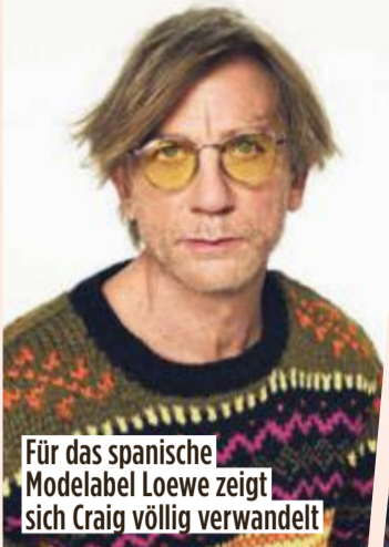
Für das spanische Modelabel Loewe zeigt sich Craig völlig verwandelt

Schauspieler Lars Eidinger (48)! So trägt Craig einen bunten Strick-Pullover, eine gelb getönte Brille und Langhaar-Frisur. Diese coole Optik sieht Filmstar Eidinger („Sterben“) zum Verwechseln ähnlich. Vielleicht tauschen die beiden Top-Schauspieler nun öfters die Rollen. mp