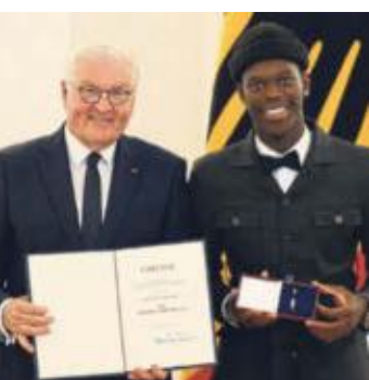
DBB-Kapitän Dennis Schröder (r.) mit Bundespräsident Frank-Walter Steinmeier