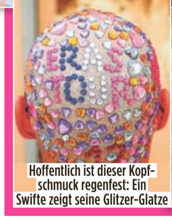
Hoffentlich ist dieser Kopfschmuck regenfest: Ein Swiftie zeigt seine Glitzer-Glatze

Take That oder bei Helene Fischer (39) war die Begeisterung je so groß. Dass sich Gelsenkirchen, wenn auch mit einem Augenzwinkern, in „Swiftkirchen“ umbenannt hat, ist einmalig. Auch die Deutsche Bahn springt auf den Zug auf und postete auf Instagram eine „Swiftkirchen Hbf“-Fotomontage. Bereits seit dem frühen Morgen warteten Fans vor der Arena auf Einlass. Der Mega-Star selbst schwebte gestern mit ihrem Privat-Jet um 13.30 Uhr in Düsseldorf ein. Offenbar mit an Bord: Travis Kelce (34), Taylors Liebster! Er verfolgte den Auftritt seiner Liebsten ganz lässig von einer VIP-Loge aus.