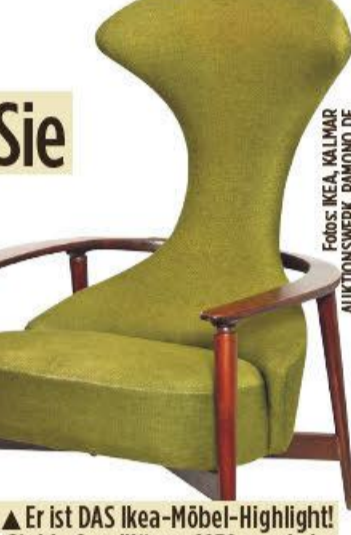
Er ist DAS Ikea-Möbel-Highlight! Stuhl „Cavalli“ von 1959 wurde im Herbst 2019 für rund 13.200 Euro versteigert

Sessel „Ake“ kam 1952 auf den Markt, kostete rund 17,50 Euro. Ein Auktionshaus versteigerte ihn 2022 für 1316 Euro