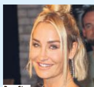
Pop-Star mit Haltung: Sarah Connor