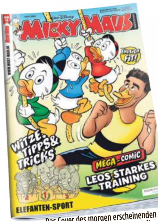
Das Cover des morgen erscheinenden Micky-Maus-Heftes

PERSÖNLICHE STERNEDEUTUNG! Nutzen Sie Ihr 15-minütiges Gratisgespräch unter 0800/53 53 508 (gebührenfrei)