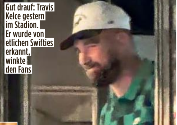
Gut drauf: Travis Kelce gestern im Stadion. Er wurde von etlichen Swifties erkannt, winkte den Fans