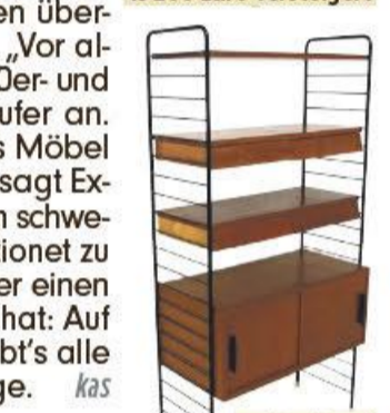
Das Regal „Cortina“ besteht aus einer Kombination von Metall und Teakholz