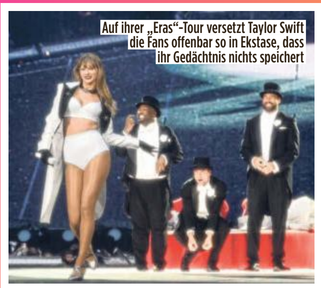
Auf ihrer „Eras“-Tour versetzt Taylor Swift die Fans offenbar so in Ekstase, dass ihr Gedächtnis nichts speichert