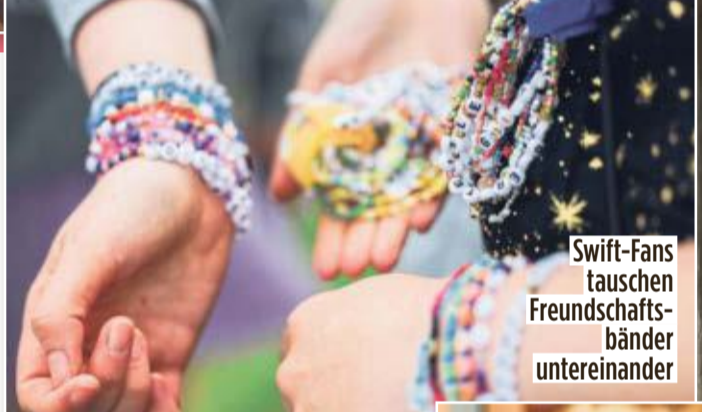
Swift-Fans tauschen Freundschaftsbänder untereinander

Taylor Swift (34) gab gestern Abend ihr erstes von sieben Konzerten in Deutschland. 60 000 Fans kamen nach Gelsenkirchen und wurden von ihrem Idol auf deutsch begrüßt: „Guten Abend“, rief Taylor ihren „Swifties“ (so nennen sich ihre Fans) zu. Und: „Schön, euch zu sehen.“ Dann legte die Pop-Göttin los: Direkt mit „Cruel Summer“, einem ihrer Mega-Hits, der im Netz schon milliardenfach angehört wurde. Ihre Auftritte waren zum Teil innerhalb von Minuten ausverkauft. Trotz Teuer-Tickets: 100 und 300 Euro pro Karte, im VIP-Bereich zahlt man sogar 600 Euro. Weder bei den Beatles,