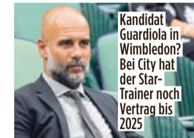
Kandidat Guardiola in Wimbledon? Bei City hat der Star-Trainer noch Vertrag bis 2025

Dann läuft der Vertrag des Star-Trainers beim Klub aus.