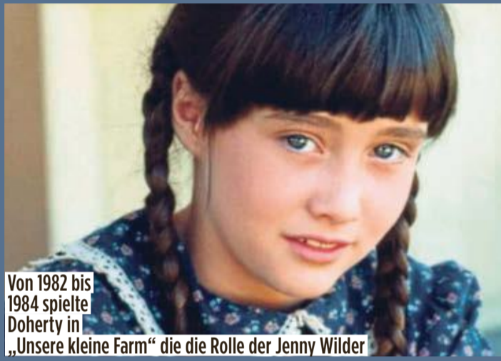
Von 1982 bis 1984 spielte Doherty in „Unsere kleine Farm“ die Rolle der Jenny Wilder