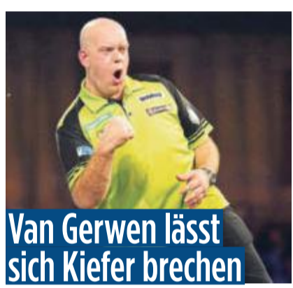
Van Gerwen lässt sich Kiefer brechen

Er kann sich Liebhaberei leisten. Der in Monaco lebende Pogacar bekommt schätzungsweise sechs Millionen Euro pro Jahr von seinem Team UAE.