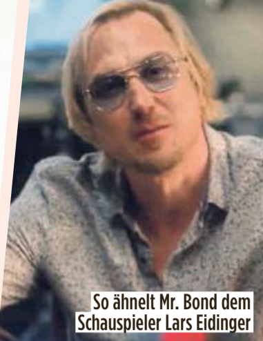
So ähnelt Mr. Bond dem Schauspieler Lars Eidinger