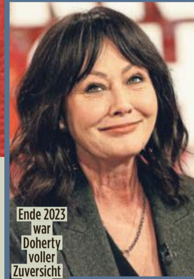
Ende 2023 war Doherty voller Zuversicht in der „Kelly Clarkson Show“ im US-TV