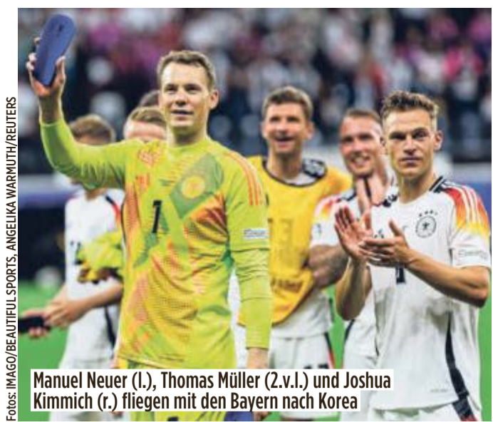
Manuel Neuer (l.), Thomas Müller (2.v.l.) und Joshua Kimmich (r.) fliegen mit den Bayern nach Korea