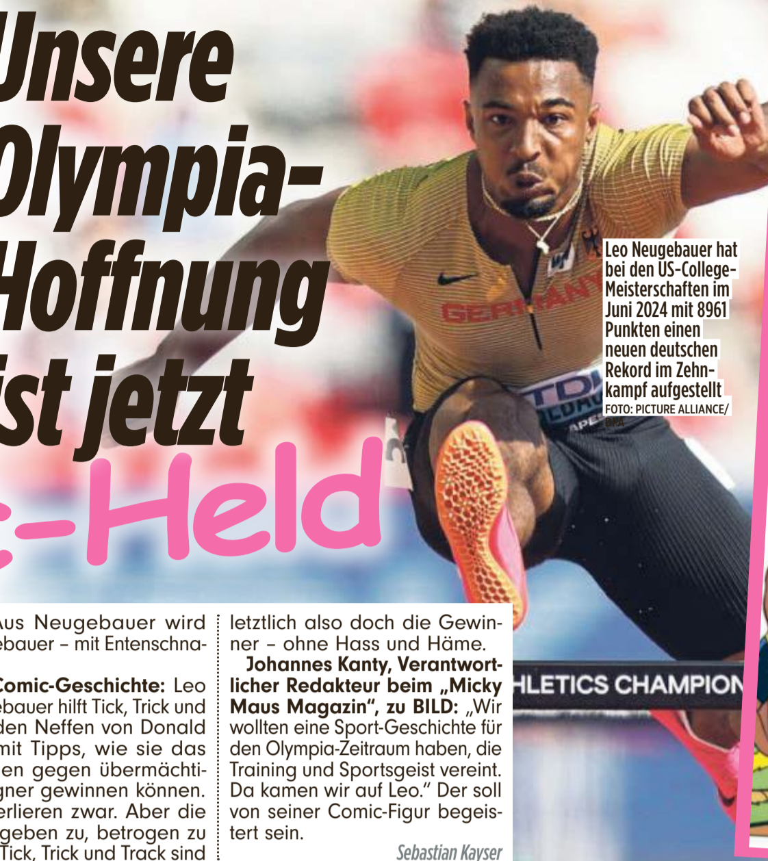
Leo Neugebauer hat bei den US-College-Meisterschaften im Juni 2024 mit 8961 Punkten einen neuen deutschen Rekord im Zehnkampf aufgestellt.