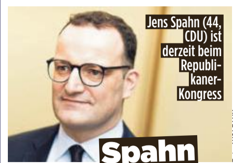
Jens Spahn (44, CDU) ist derzeit beim Republikaner-Kongress

Ein Ampel-Haushälter kritisiert in BILD: „Lindner musste unbedingt seine Schuldenbremse bekommen. Damit die zumindest auf dem Papier eingehalten wird, wurde beim Bürgergeld mit sehr, sehr ambitionierten Einsparungen gerechnet. Ob das so aufgeht, werden wir sehen.“