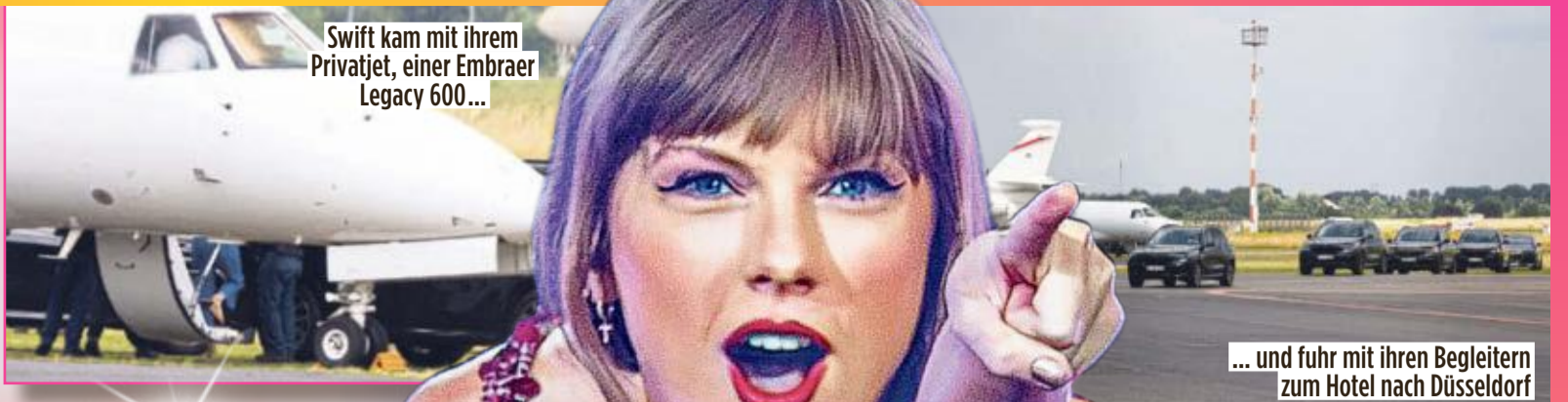
Swift kam mit ihrem Privatjet, einer Embraer Legacy 600...